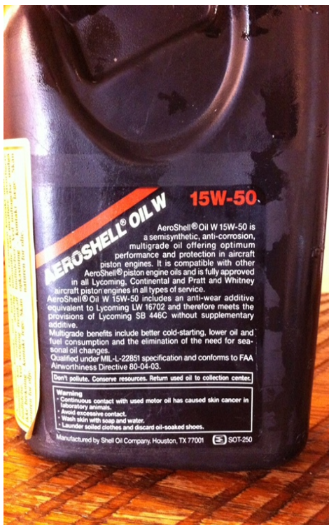
Achterkant voor Cessna 172

Zoals we allemaal weten zit een ongeluk in een klein hoekje en is het dus van groot belang om altijd opmerkzaam te blijven in de luchtvaart. Daarom waren we blij dat een van de leden ontdekte dat er door onduidelijke etikettering verkeerde olie in het verkeerde vliegtuig gestopt kan worden.