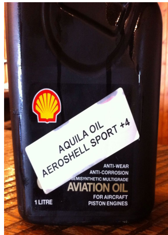
Voorkant voor Aquila

Dus blijf scherp en meld!!!!!!!!!!!!!!!!!!!!!!